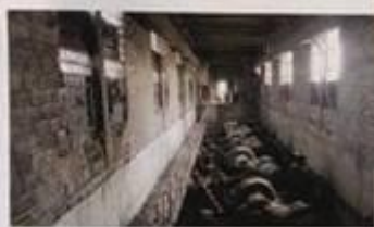
SALA POMPELOR SPA JILAVA INAINTE DE REPARATIE