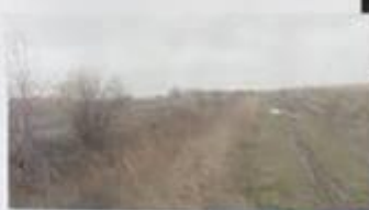
CANAL CA INAINTE DE REPARATIE