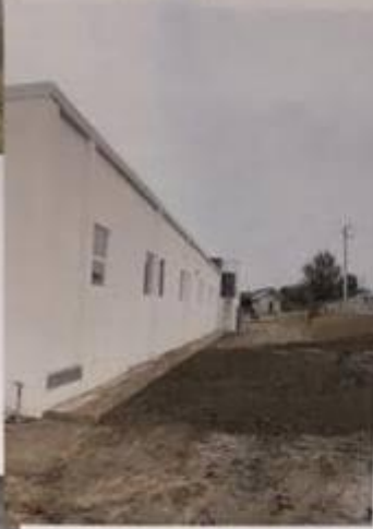
SPA JILAVA DUPA REPARATIE