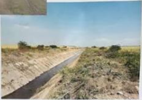
CANAL CA DUPA REPARATIE