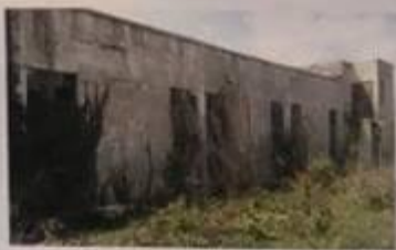
SPA JILAVA INAINTE DE REPARATIE