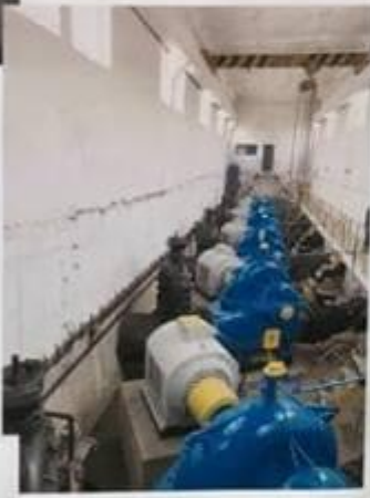
SALA POMPELOR SPA JILAVA DUPA REPARATIE